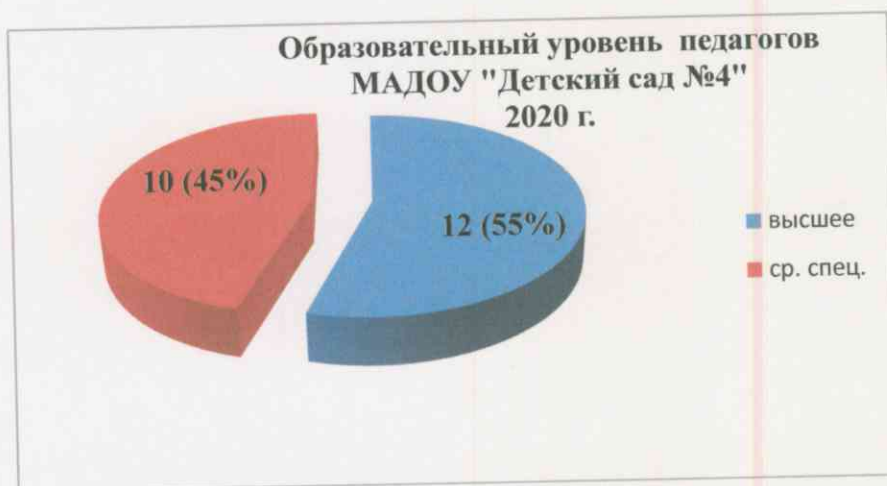
Диаграмма с характеристиками кадрового состава МАДОУ «Детский сад №4»

МАДОУ «Детский сад №4» укомплектован педагогами на 100 % согласно штатному расписанию. Всего педагогических работников 22, из них: 18 воспитателей, 2 музыкальных руководителя, 2 инструктора по физической культуре.